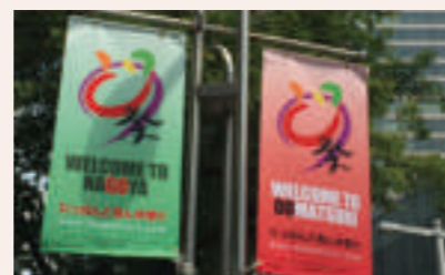
▲ エリアマネジメント広告 (愛知県名古屋)