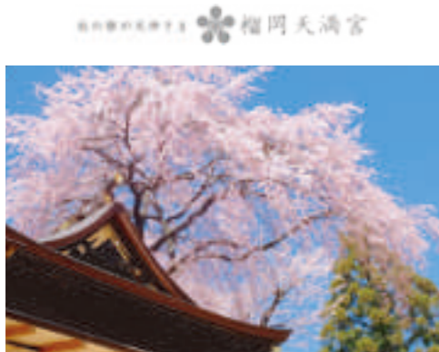
📍 榴岡天満宮 つつじがおかてんまんぐう