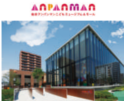
📍 仙台アンパンマン こどもミュージアム&モール