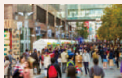
▲ FUKUOKA STREET PARTY (福岡県福岡市)

仙台市においても、アーケード商店街（中心部商店街活性化協議会）や、荒井東地区（荒井タウンマネジメント）等において取り組みが進められており、仙台駅東地区でも、宮城野通や榴岡公園をはじめとした特徴ある地域資源を生かした持続的なエリアマネジメント活動を、仙台駅東まちづくり協議会が中心となり推進して行きたいと考えています。