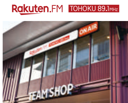
📍 Rakuten.FM TOHOKU らくてんドットエフエム とうほく