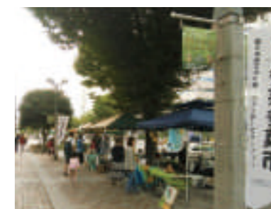
▲ 多芸多菜市の様子