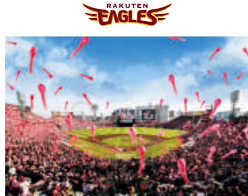
📍 楽天生命パーク宮城 らくてんせいめいぱーくみやぎ