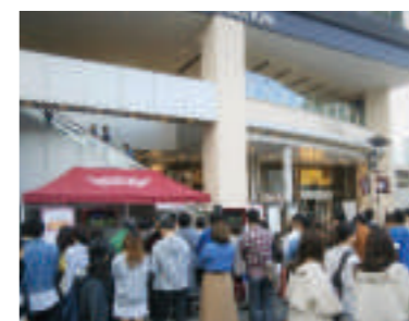
▲ ライブビューイングの様子